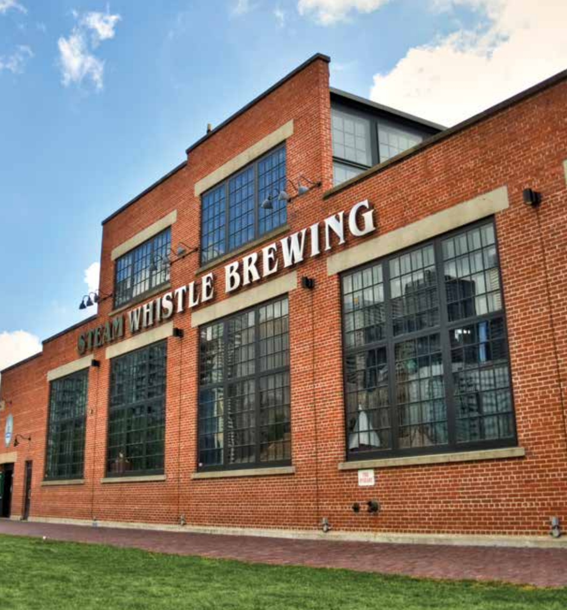
Built in 1929 to service the CPR's steam locomotives, John Street Roundhouse in downtown Toronto now houses the well-known Steam Whistle Brewery.