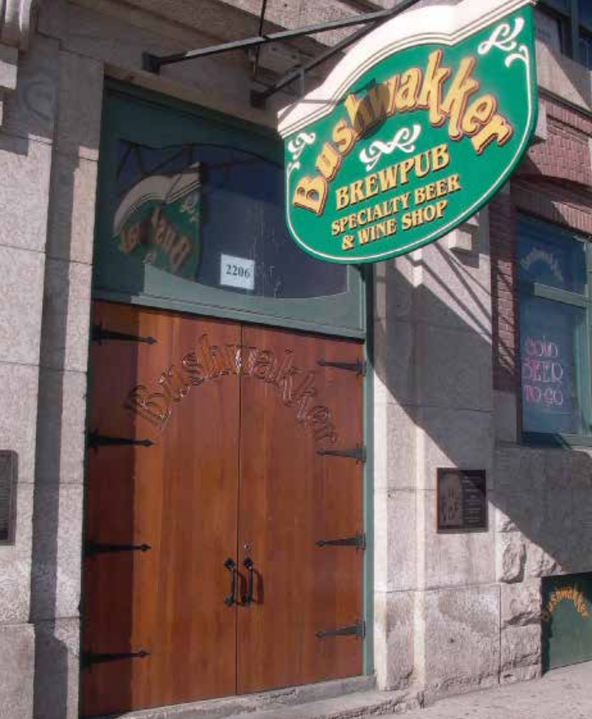
The Bushwacker Brewpub has been operating in the restored Strathdee Building—a five-storey landmark in Regina’s old warehouse district—since 1991.