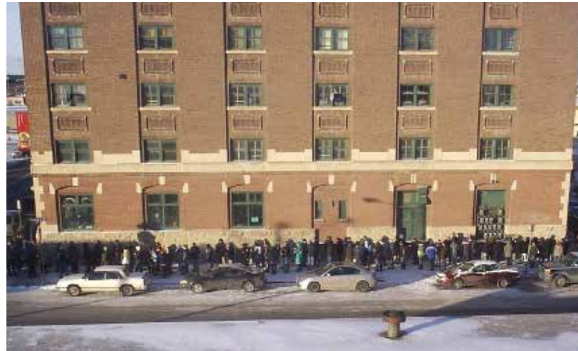
The annual Blackberry Mead release is just one of many popular special events—some aimed at supporting community cultural groups—held at Regina’s Bushwakker Brewpub.

la rotonde de la rue John sans clouer, visser ou boulonner quoi que ce soit dans la structure d’origine du bâtiment. « Le support entre les deux structures est assuré par des crampons, qui peuvent être utilisés sans percer le bâtiment d’origine et qui peuvent être enlevés si jamais nous quittons », dit M. Taylor.