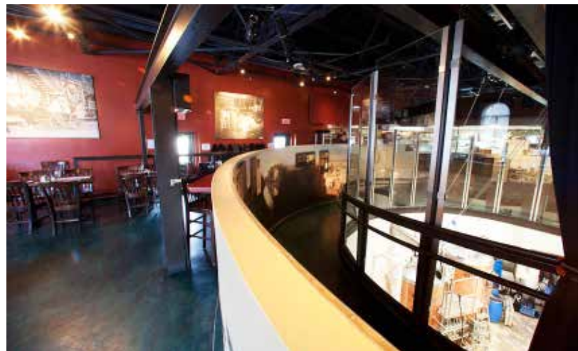
Visitors to Les Brasseurs du Temps microbrewery in Gatineau can view the vats and follow a 200-metre course through the history of beer brewing in the Outaouais region.

Le Blackberry Mead a lieu chaque année à la brasserie Bushwakker de Regina. Il n’est qu’un des nombreux événements spéciaux qui y sont organisés, y compris certains au profit de groupes culturels communautaires.