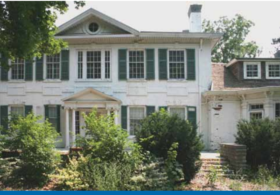
Bellevue House, Amherstburg, Ontario