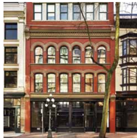
Left: The hand-carved stone entrance was re-created and glass bricks reinstalled in the sidewalk as part of Fung's rehabilitation of the Flack Block. Above: The refurbished former Grand Hotel, now part of The Garage row.