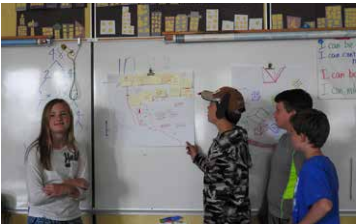
Left and Right: Students shared their ideas for downtown Nakusp, British Columbia, during a Main Street Boost in July.