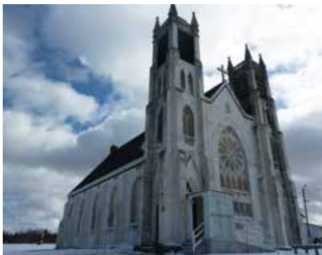
The National Trust's pilot Launch Pad mission brought together heritage experts, students and local stakeholders to find creative solutions to save Saint Alphosus Church in Victoria Mines, Nova Scotia.