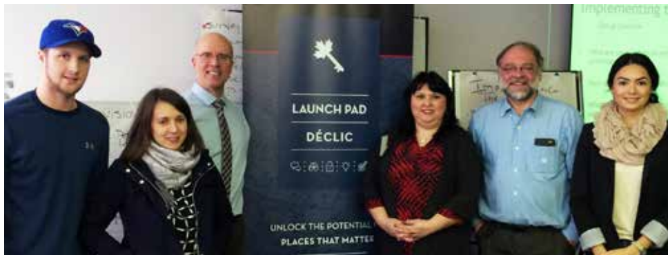
La mission pilote Décllic de la Fiducie nationale a permis de réunir des spécialistes du patrimoine, des étudiants et des intervenants locaux afin de trouver des solutions créatives pour sauver l'église Saint Alphosus à Victoria Mines, en Nouvelle-Écosse.