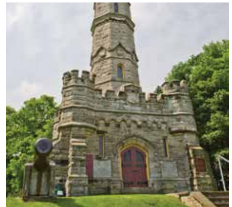
Where HISTORY is revealed

B ounded by the picturesque southern shores of Lake Ontario and the lush landscape of the Niagara Escarpment, a Unesco World Biosphere Reserve, Hamilton offers incredible access to conservation and recreation lands, a natural playground for cyclists, hikers, boaters and other outdoor adventurers. More than 100 waterfalls can be found off wooded trails just minutes from the city's core as well as stunning waterfronts at Pier 8, Bayfront and the Beachfront. Hamilton is also home to world-class, outdoor family attractions including Royal Botanical Gardens showcasing 1,100 hectares of beautiful cultivated gardens and spectacular nature sanctuaries, and African Lion Safari featuring more than 1,000 exotic birds and animals from around the world and an Ontario Signature Experience, Wake Up the Wild.