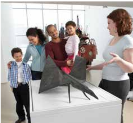
Where THE ARTS thrive

Rich in culture and history and surrounded by spectacular nature, Hamilton is a city like no other. Ideally located in the heart of southern Ontario, less than an hour's drive from Toronto and Niagara Falls, Hamilton provides an ideal destination for a visit or detour. From its vibrant arts scene, to its rich heritage and history, to its incredible natural beauty... It's Happening Here!