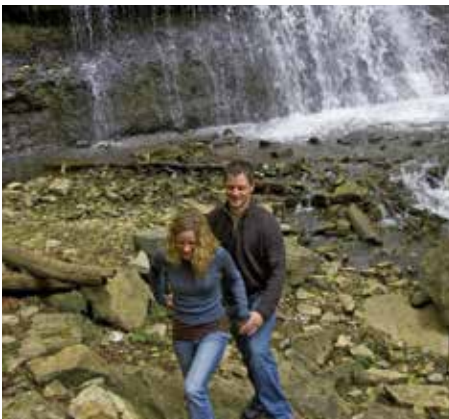
Where NATURE surrounds

H amilton is making headlines for its grassroots arts revival, recently compared to Brooklyn by The Huffington Post. The monthly art crawls along James St. North draw thousands of art-lovers and fun-seekers culminating in a huge annual street party celebrating local arts and culture called Supercrawl. Similar artistic and creative hubs can be found in neighbourhoods across the city. The city is home to Ontario's third largest public gallery the Art Gallery of Hamilton, and one of the country's leading university art collections at the McMaster Museum of Arts. World class performing arts venues, intimate performance spaces and countless clubs showcase a breathtaking range of musical and theatrical talent. The city's burgeoning culinary scene is also making headlines with a new and exciting food movement taking over Hamilton.