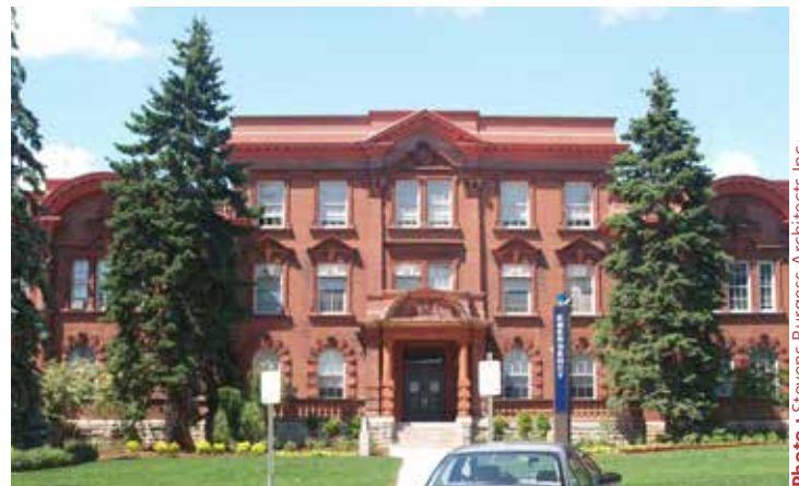
The Macdonald Institute, University of Guelph

L'immeuble administratif de Bridgepoint Active Healthcare à la prison Don à Toronto a également gagné un prix dans cette catégorie. Dans ce projet, l'ancienne prison Don, qui a été construite en 1864 et qui était particulièrement mal en point, a été intégrée à un nouveau complexe de soins de santé. Un plan d'étage rigide, conçu pour l'isolation et la séparation, a été transformé en espace ouvert, accueillant et fonctionnel. La rotonde centrale, une rangée de cellules et le secteur de la potence ont été préservés pour qu'ils restent visibles au public. Les cabinets ERA Architects Inc. et +VG Architects Ltd. ont accepté le prix.