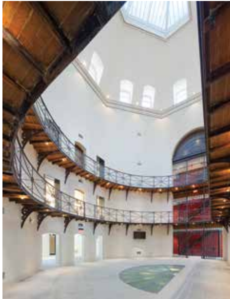
Don Jail: Bridgepoint Active Healthcare Administration Building, Toronto

For more information about these projects visit heritagecanada.org .