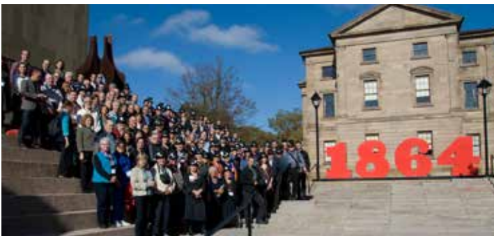
Group photo, everyone! Charlottetown Conference 2014.