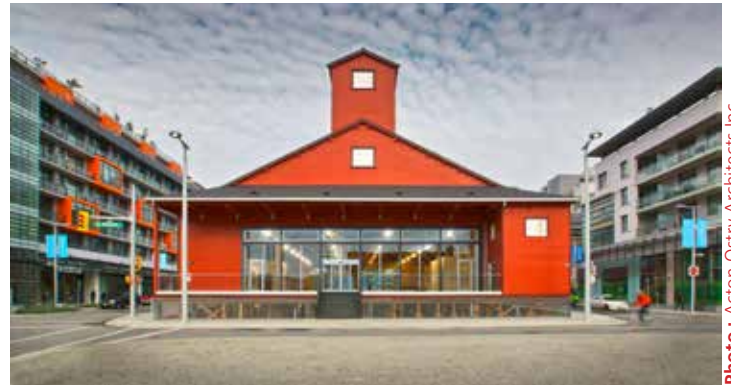
The Salt Building, Vancouver