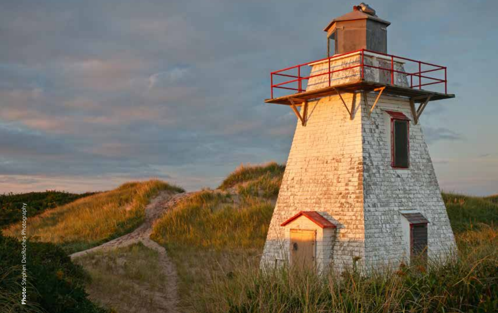
A local group has petitioned for ownership of St. Peter's Harbour Lighthouse (1881), inactive since 2008.