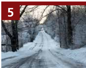
5 Amherst Island, Lake Ontario, just west of Kingston, Ont./Île Amherst, lac Ontario, immédiatement à l'ouest de Kingston (Ontario)

Datant des années 1870 et situés au cœur du centre-ville de Hamilton, les bâtiments contribuent à l'unique alignement de façades qui comprend des structures d'avant la Confédération et qui aide à définir le caractère du parc Gore. Nombreux sont ceux qui considèrent l'ensemble comme essentiel à la revitalisation du secteur. Une entente conclue avec la ville permet au propriétaire de démolir les bâtiments en échange d'une promesse de préserver les façades des numéros 18 à 22 – même s'il n'y a pas de projet immédiat de réaménagement du site. La FHC et d'autres intervenants ont écrit au ministre du Tourisme, de la Culture et du Sport de l'Ontario, lui demandant de rendre une ordonnance interdisant la démolition. Entre-temps, des conseillers municipaux ont obtenu du propriétaire un sursis donnant plus de temps pour trouver une solution.