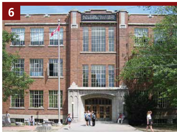
6 Kingston Collegiate Vocational Institute (KCVI), Kingston, Ont./Kingston Collegiate Vocational Institute (KCVI), Kingston (Ontario)

Les attributs champêtres bien préservés de l'île Amherst ont contribué à son intérêt comme paysage du patrimoine culturel et naturel. Seulement accessible par traversier, l'île (20 km sur 5), possède des lieux historiques désignés, des aires géographiques et des éléments de paysages bien définis des premiers occupants venus d'Irlande et d'Écosse qui sont restés inchangés depuis 100 ans. Elle posséderait aussi d'importants dépôts archéologiques, elle est située sur la voie migratoire de l'Atlantique et elle est reconnue internationalement pour ses concentrations de rapaces en hivernage. Algonquin Power/Windlectric propose de créer une installation industrielle d'énergie éolienne qui serait répartie sur l'ensemble de l'île, comprenant 36 éoliennes de 51 étages de hauteur, avec des pales balayant une superficie de 2 acres.