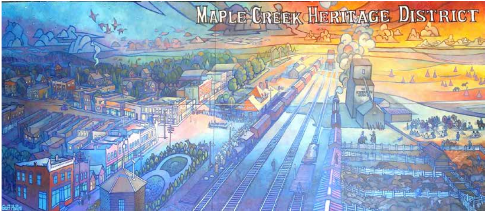
Maple Creek's Heritage District Gateway Mural depicts downtown at the turn of the century. Artist Geoff Philips was commissioned by the Maple Creek Main Street Program.