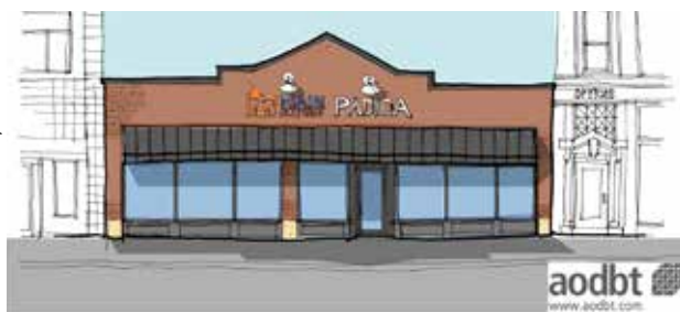
Sketch: Jason Hurd, aodbt architecture + interior design