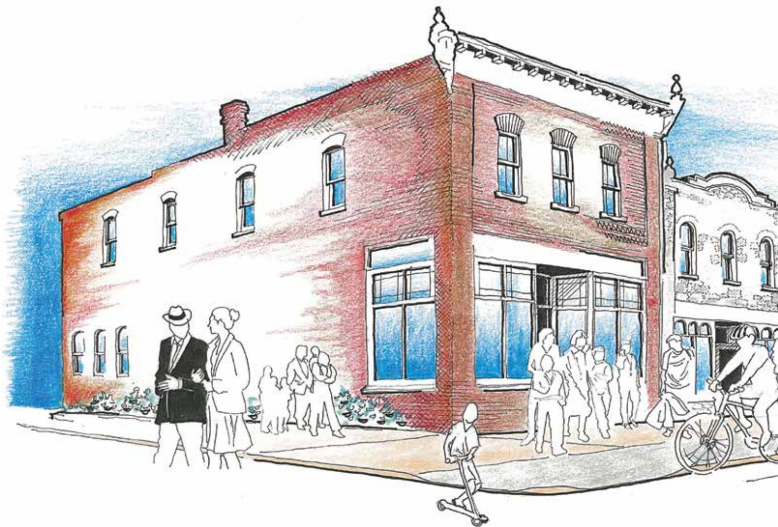
A character sketch by Murray G. Miller, Heritage Consultant, depicting the revitalization potential along Maple Creek's Pacific Avenue, courtesy of Maple Creek Main Street Program.

Great change is afoot in rural Saskatchewan where four communities—Indian Head, Wolseley, Prince Albert and Maple Creek—are in their third year of the Main Street Saskatchewan Demonstration Program.