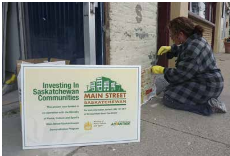
Metal cladding was removed from 510 Grand Avenue as part of Main Street Indian Head's façade improvement program, reinstating the original storefront configuration.