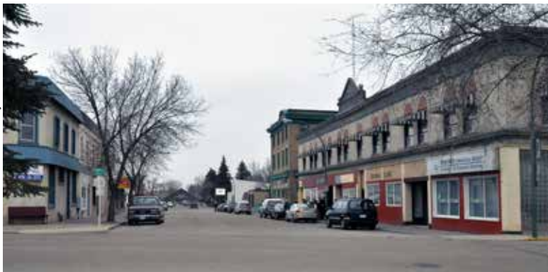
The corner of Sherbrooke and Front streets in Wolseley showing the Perley Block (1906) on the right before its rehabilitation began.

Wolseley's official motto "A Town Around a Lake" captures the essence of this picturesque historic railway town. Although small in size (fewer than 1,000 inhabitants), Wolseley has a lot to brag about. It boasts the oldest