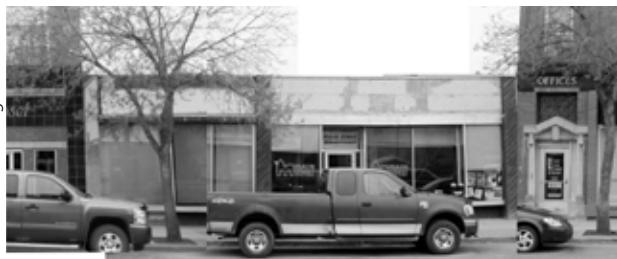
Cette année, le départ officiel du Championnat canadien de course en traîneaux à chiens sera donné le 18 février à midi sur la rue principale de Prince Albert, l'avenue Central.