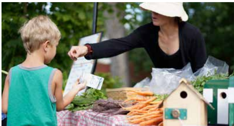
Main Street Indian Head's Farmers Market offers everything from fresh produce and homemade jams to crafts and entertainment.

This small town of just over 1,800 is a proud and vibrant community. An active participant in the Communities in Bloom program, Indian Head raised $1.5 million for the restoration of the historic Bell Barn and played host to CBC's popular sitcom Little Mosque on the Prairie .